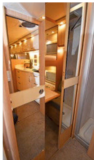
Charakteristikum des Maxi-Alkoven 8300 STX: das Kinderzimmer mit Stockbetten im Heck. Es enthält eine kleine Sitzgruppe mit Tisch und ist per Schiebetür abtrennbar – hier hat der Nachwuchs sein eigenes Reich. ▶