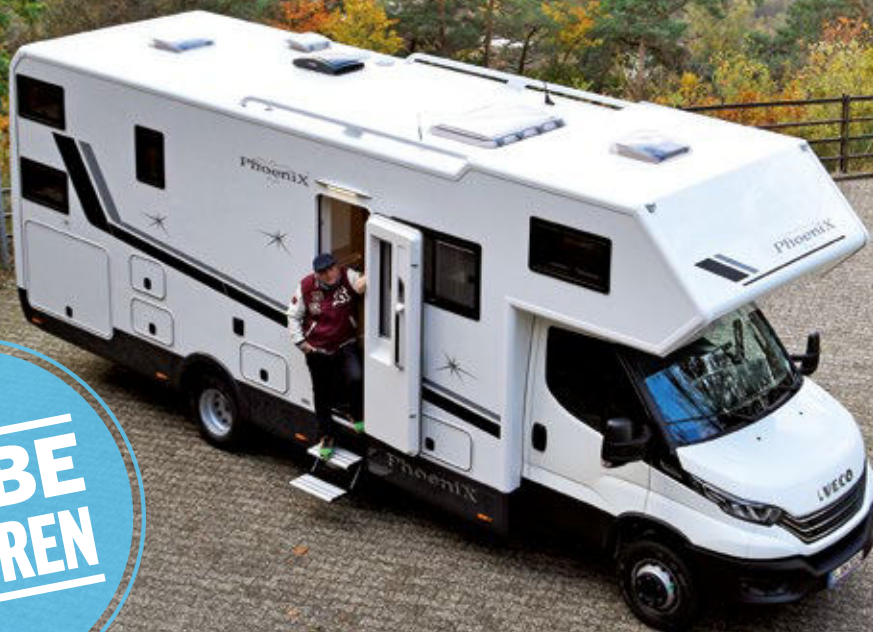
Text und Fotos: Simon Ribnitzky